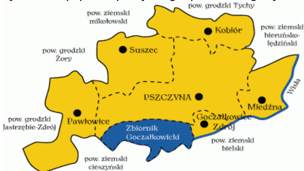
Rysunek 1. Mapa powiatu pszczyńskiego z podziałem na gminy

Powiat pszczyński leży w południowej części województwa śląskiego na przecięciu tras Katowice – Żory – Wisła (DK81) oraz Katowice – Bielsko (DK1), pomiędzy Górnośląskim Okręgiem Przemysłowym a Beskidami. W południowej części powiatu znajduje się zbiornik wodny w Goczałkowicach, stanowiący rezerwuuar wody pitnej dla Śląska. Lokalizacja geograficzna powiatu jest korzystna, ze względu na sąsiedztwo Aglomeracji Górnośląskiej, województwa małopolskiego, Katowickiej Specjalnej Strefy Ekonomicznej, granic państwa, oraz położenia na ważnych szlakach komunikacyjnych kolejowych i drogowych.